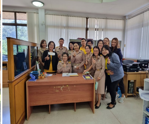
กิจกรรมร่วมอวยพรวันคล้ายเกิดพนักงานส่วนตำบล