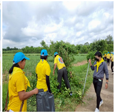
กิจกรรมงานประเพณีของดีคอนสวรรค์